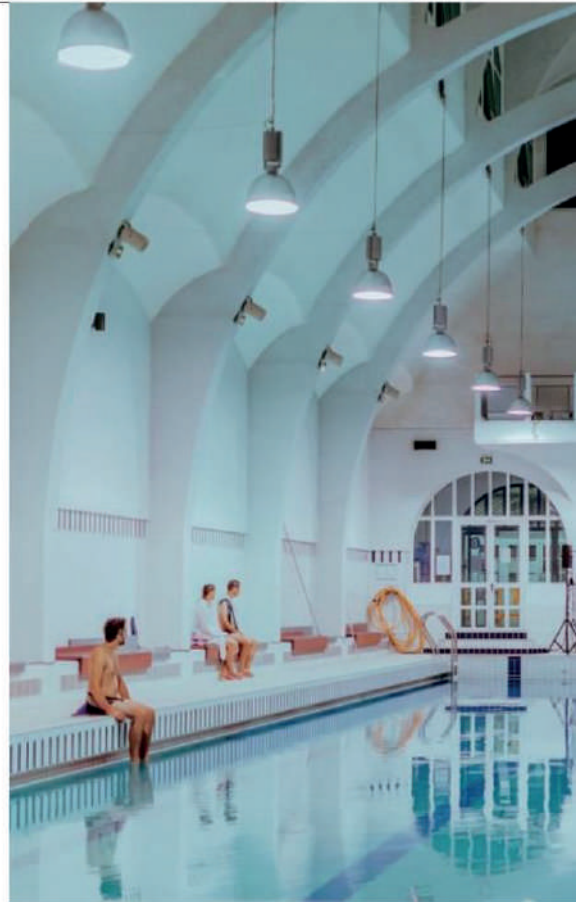
Dans la piscine de la Butte aux Cailles, à Paris dimanche dernier, lors