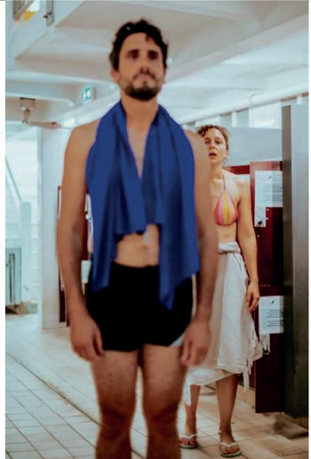
des répétitions du spectacle Iris d'Alessandro Sciaroni.