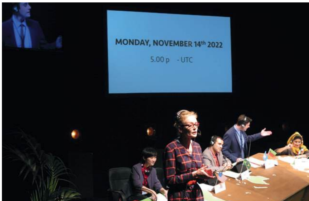
Kyoto Forever 2 , Création 2015.