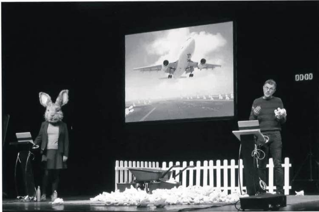
Le Problème lapin. Cartographie 7, spectacle-conférence de Frédéric Ferrer, compagnie Vertical Détour, 2021.

l'oralité. Le croisement de ces deux aspects me paraissait pertinent. Il permet, par l'oralité, de s'ajuster en permanence à l'immédiateté des changements.