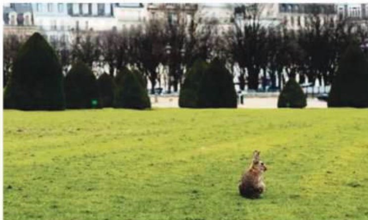
Le lapin, «farceur qui ne respecte pas les règles des humains».