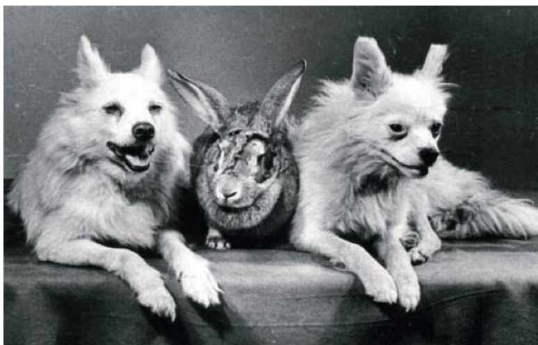
Otvaznaya, Snezhinka et le lapin Marfusha

Le lapin Marfusha est le premier lapin astronaute de l'histoire. Il a effectué un vol d'essai à bord d'une fusée soviétique R2-A le 02 juillet 1959 en compagnie de 2 chiennes : Otvaznaya et Snezhinka.