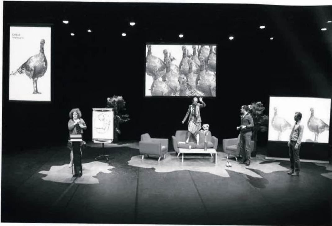
Borderline(s) Investigation #1 , spectacle-conférence de Frédéric Ferrer, compagnie Vertical Détour, 2018. © Mathilde Delahaye.